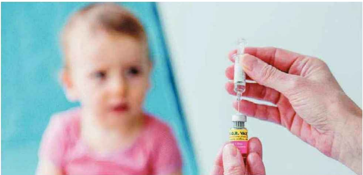
Vaccination ROR d'un bébé de 18 mois. Un contributeur de la consultation nationale remarque que « la France est l'un des derniers pays à maintenir une obligation vaccinale. Chacun doit pouvoir décider pour son corps et celui de ses enfants. »

Au-delà du débat scientifique (voir ci-dessous, la myofasciite à macrophages) sur cet adjuvant, d'autres s'agacent franchement du débat actuel. « La méfiance des Français à l'égard des vaccins en général ressemble à l'attitude des enfants gâtés! » remarque un participant. Un autre pense que « la défiance de certains vis-à-vis de la vaccination est liée au fait que la crainte des effets adverses a remplacé la peur des maladies », cependant qu'un troisième conclut : « Bien sûr, elle n'est pas anodine et peut avoir des conséquences, comme tout médicament, mais les bénéfices pour la société sont bien plus nombreux. » ■